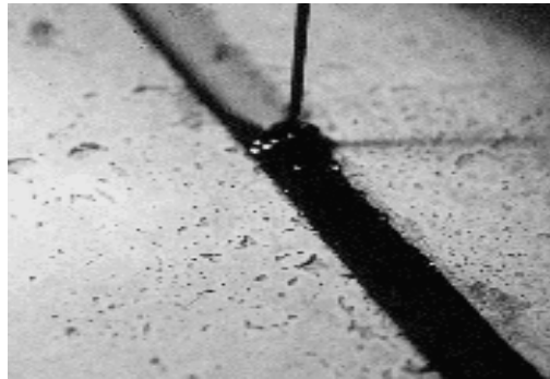
Gambar 1. Pengisian joint sealant pada sambungan perkerasan beton

Pelaksanaan pengisian joint sealant pada sambungan perkerasan beton dilakukan pada saat perkerasan beton memenuhi masa curing , berumur kurang dari 1 minggu, dimana slab beton dipotong pada setiap 5 meter, dan pada garis tengah pertemuan antara perpotongan perkerasan beton. Perubahan dari bahan dilihat setelah berumur 6 hari pelaksanaan. Bila tidak ada perubahan maka temperatur penguangan yang digunakan dapat digunakan sebagai acuan. Temperatur aman pemanasan adalah temperatur tertinggi dimana campuran dipanaskan