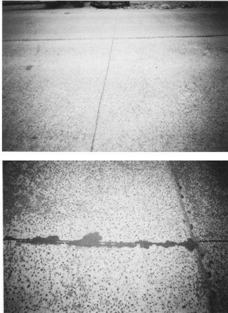
Gambar 4. Pengamatan lapangan umur 3 bulan